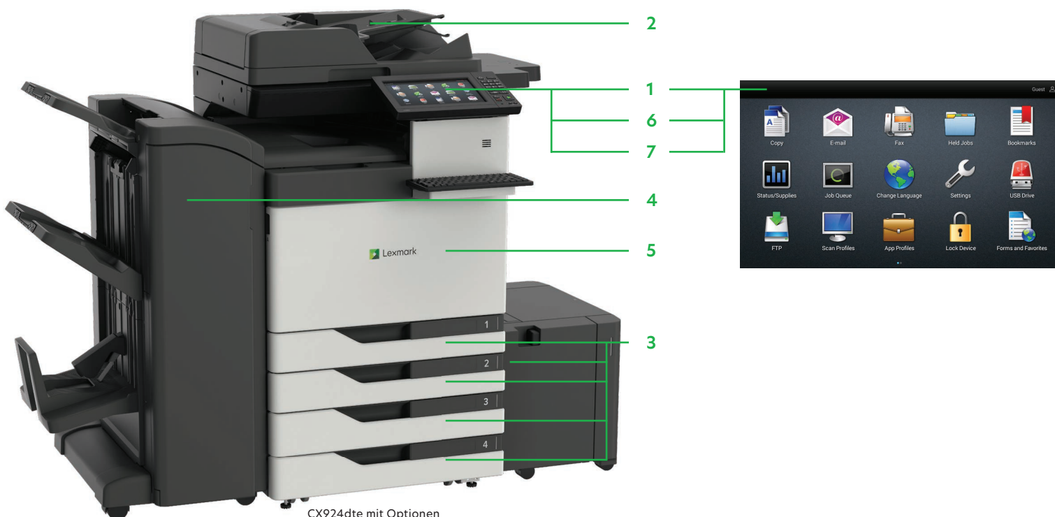
CX924dte mit Optionen

Drucken Sie Microsoft Office-Dateien, PDFs und andere Dokument- und Bildarten von Flash-Laufwerken oder wählen Sie Dokumente auf Netzwerk-Servern oder Online-Laufwerken aus und drucken Sie sie.